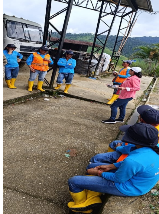
26.- Delegación Sesión Extraordinaria del GAD Provincial de la fecha 05 de Julio del 2024, en calidad de consejera provincial.